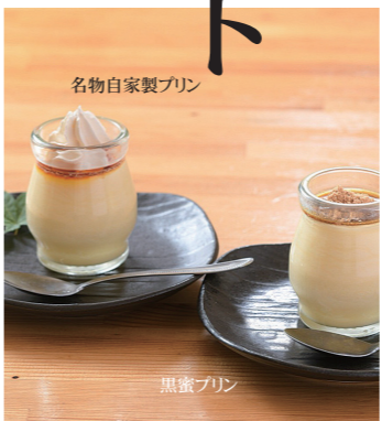
名物自家製プリン