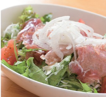
生ハムサラダ シーザーサラダ